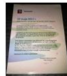
counterstrike1 2011-05-22 22:05:11