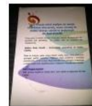
counterstrike1 2011-05-22 22:04:40