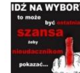
counterstrike1 2010-12-07 19:55:36