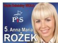
counterstrike1 2010-12-20 23:16:45