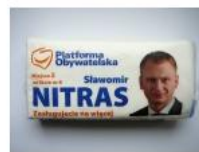
Martini 2008-09-15 18:43:32